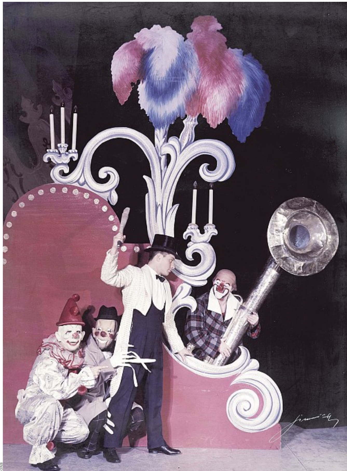
ONB Artisten, Tiere, Attraktionen: Der Zirkus lockte tausende Besucher in die Wiener Stadthalle. Im Bild: Charlie Rivel mit Clown-Kollegen