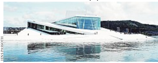
Die Oper in Oslo wurde mit dem Mies-van-der-Rohe-Preis prämiert

Architektur – Alle zwei Jahre kürt die internationale Jury des Mies van der Rohe Awards „Europas beste Bauten“. Zum ersten Mal ist die Wanderausstellung der herausragenden Projekte heuer in den Räumen des Architekturzentrum Wien (AZW) zu sehen. Von 340 Nominierten kam die Jury auf fünf Finalisten, der Hauptpreis (80.000 €) ging an das norwegische Büro