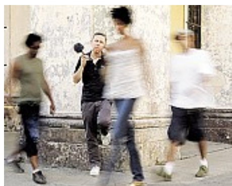
DJ Gilles Peterson in den Straßen von Havanna

Peterson: „Ich hatte Ideen, und er hat sie mit den jungen Musikern, die wir gefunden haben, realisiert.“