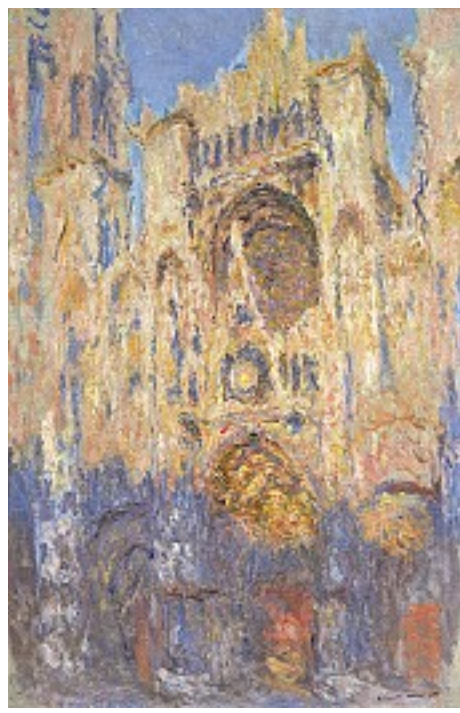
Claude Monet: Die Kathedrale von Rouen, 1892

Im Museum von Rouen, der Hauptstadt der Oberen