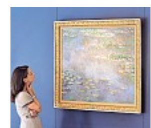
Unverkauft: Seerosen von Monet (1906) bei Christie's

In den großen Londoner Auktionshäusern gehörte die vergangene Woche den Impressionisten. Doch obwohl Christie's am Ende stolz den „höchsten Umsatz, der je bei einer Auktion in Großbritannien erzielt wurde“ verkündete, blieb die Freude getrübt: Für ein im Vorfeld bejubeltes Seerosen-Bild von Claude Monet (1906) wollte niemand die angepeilten 34 bis 45 Millionen Euro bezahlen, das Werk blieb unverkauft. Eine Monet-„Studie von Booten am