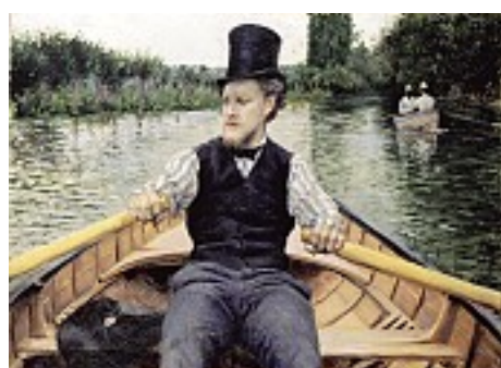
Ruderer von Gustave Caillebotte, ca. 1878

Die Küste der Normandie war seit den 1840er-Jahren per Zug mit Paris verbunden und hatte sich früh zum Sommerfrische-Zentrum für das reiche Bürgertum der Hauptstadt entwickelt. Im Museum des Orts Honfleur sind heute Bilder zu sehen, die Monets Mentor Eugene Boudin von der noblen Strandgesellschaft anfertigte. Monet selbst malte ab den 1860ern in den Seebädern der Region, eines seiner berühmtesten Frühwerke zeigt eine Terrasse in Sainte Adresse, einem Vorort der Stadt Le Havre, in der der Maler seine Kindheit verbracht hatte.