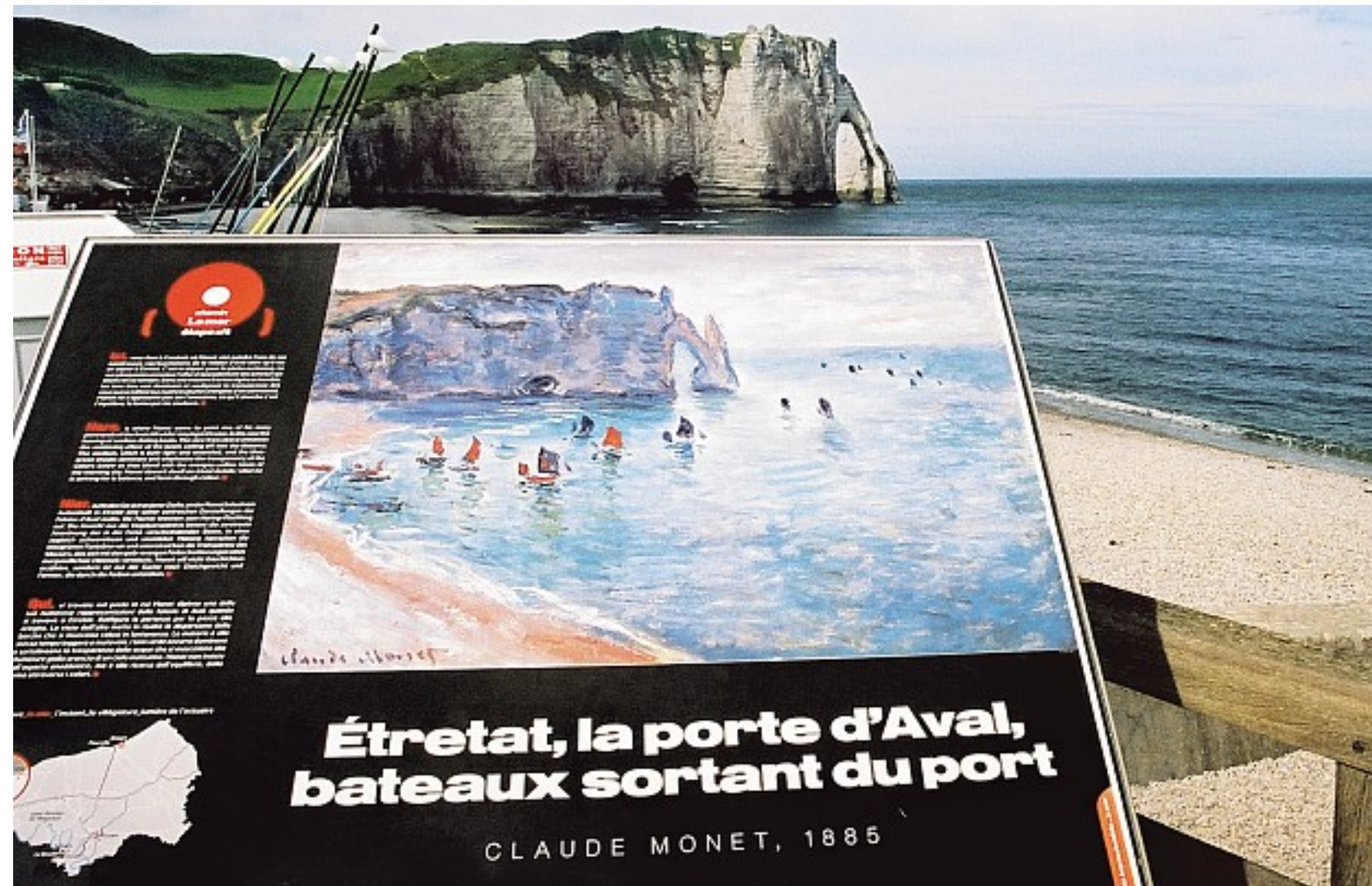
Étretat: Die Felsformationen nahe des einstigen Fischerdorfs an der Ärmelkanal-Küste faszinierten Künstler und Reisende. Zu Monets Zeit war der Ort bereits touristisch erschlossen

Normandie, sind neun Arbeiten aus Monets berühmter Serie zu sehen, die die Fassade der örtlichen Kathedrale zeigt. 30-mal malte der Künstler die Kirche in verschiedenen Lichtstimmungen, er betrat sie aber nur einmal – als schwarze Fahnen seine Sicht störten.